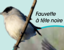
Fauvette à tête noire