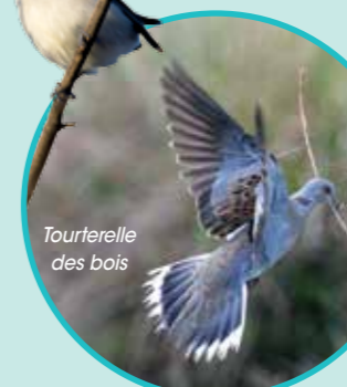
Tourterelle des bois

Nota : ce point d'observation n'est pas accessible à certaines périodes, par quiétude pour les Cistudes d'Europe. Merci de respecter les indications disposées à cet effet.