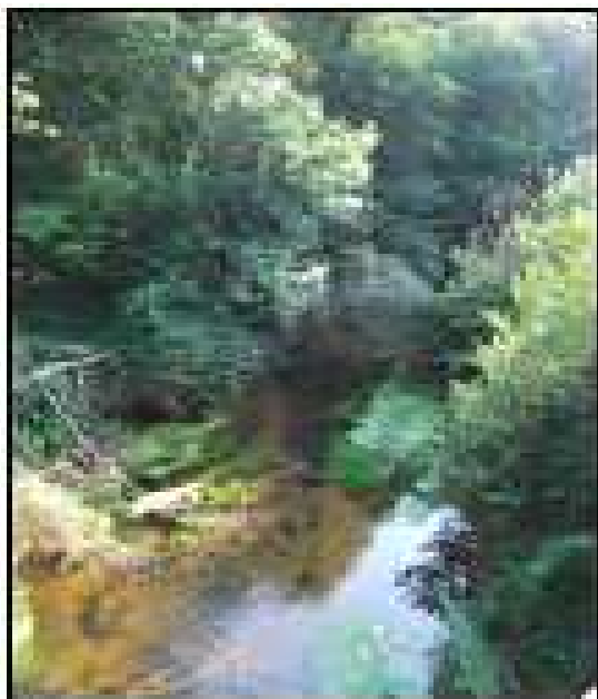
Estrigon à Cère